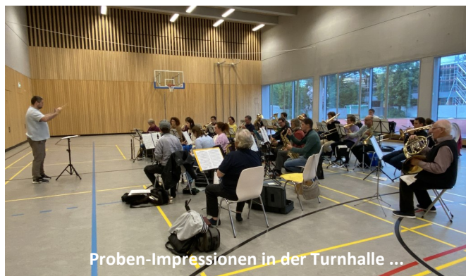
Proben-Impressionen in der Turnhalle ...