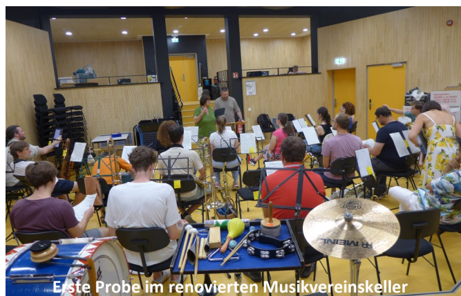
Erste Probe im renovierten Musikvereinskeller