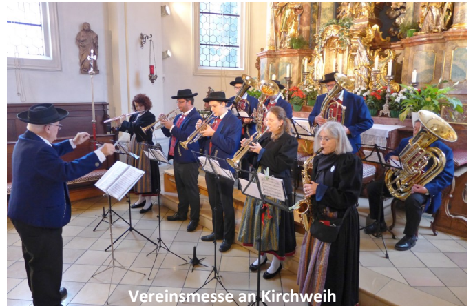
Vereinsmesse an Kirchweih

Programm der Sommerserenade am 06.07.2025: