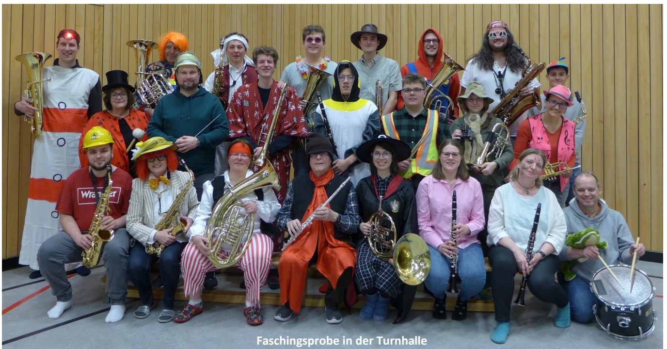
Faschingsprobe in der Turnhalle

Am 27. Juni eröffnete die Blaskapelle wie jedes Jahr mit einem Standkonzert am Rathaus das Bürgerfest und gab die Marschmusik vor zum Einzug ins Festzelt, der auf den letzten Metern von einem Regenschauer überrascht wurde. Die anschließende Fahrt auf dem Karussell ist inzwischen zu einer guten und heiteren Tradition geworden. Der Bürgerfest-