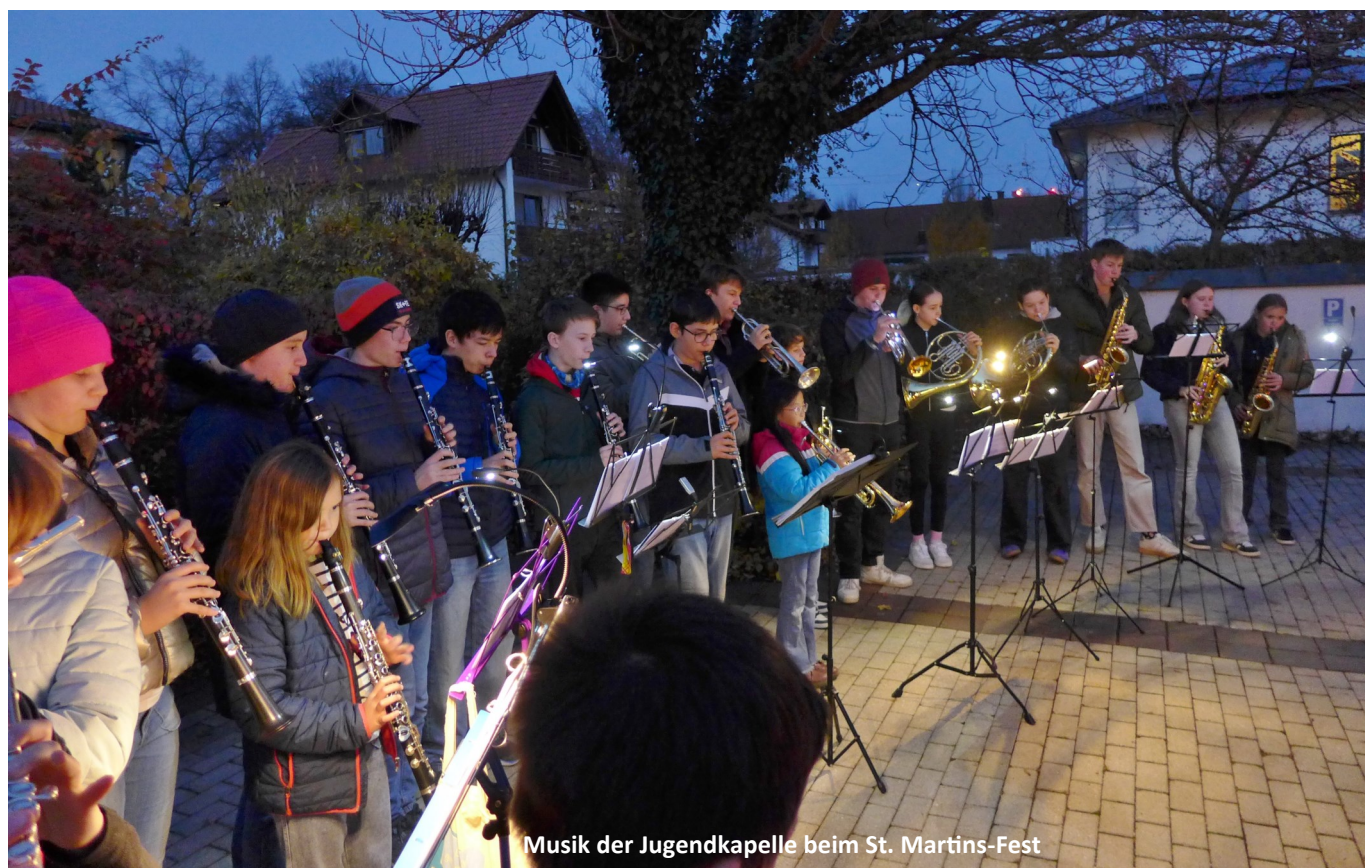
Musik der Jugendkapelle beim St. Martins-Fest