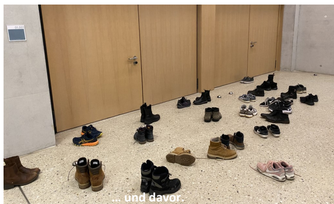
... und davor.