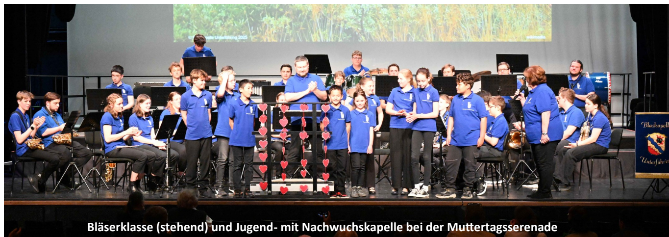
Bläserklasse (stehend) und Jugend- mit Nachwuchskapelle bei der Muttertagsserenade