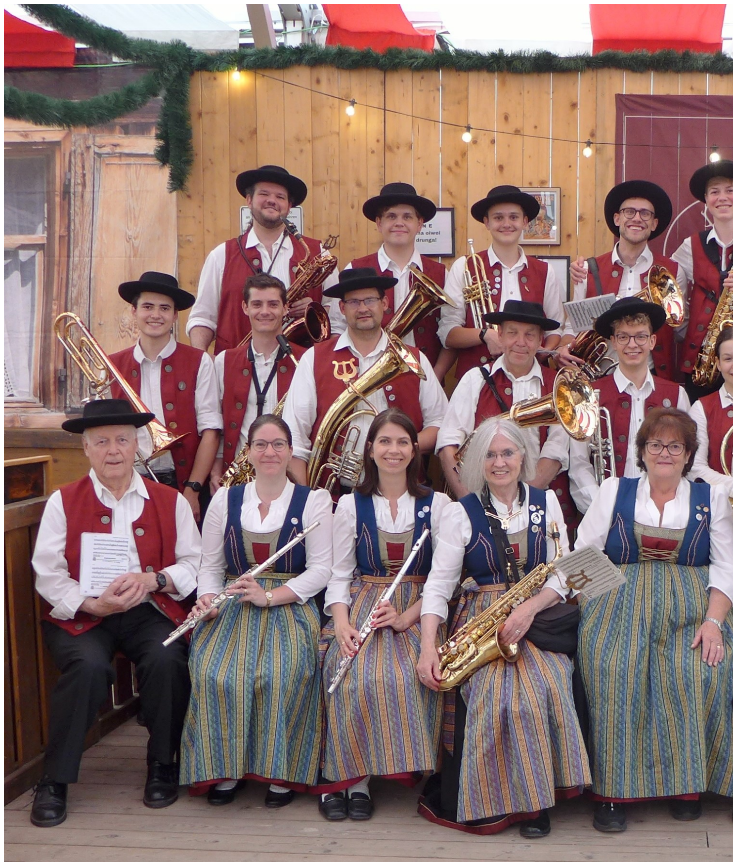
Die Blaskapelle Unterföhring mit Jugendskapelle am Tag der Eröffnung des Bürgerfestes am 27.06.2025