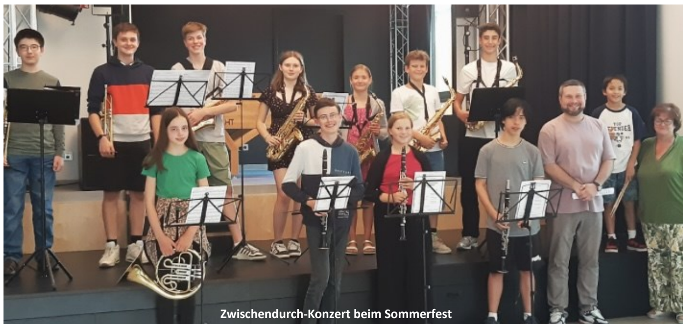
Zwischendurch-Konzert beim Sommerfest