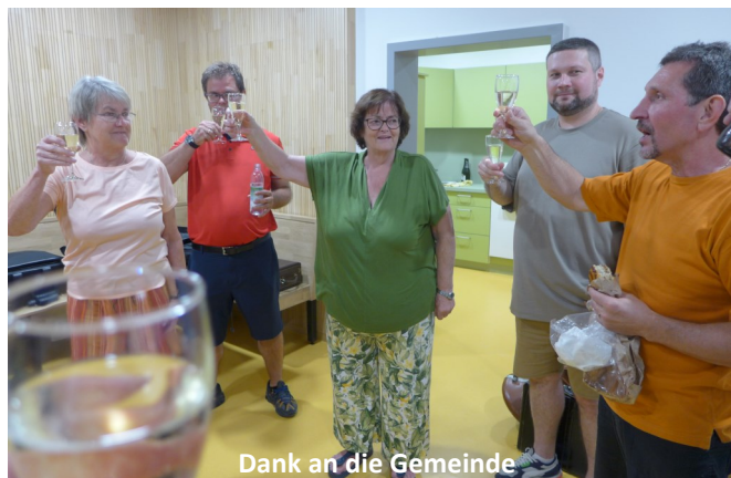
Dank an die Gemeinde