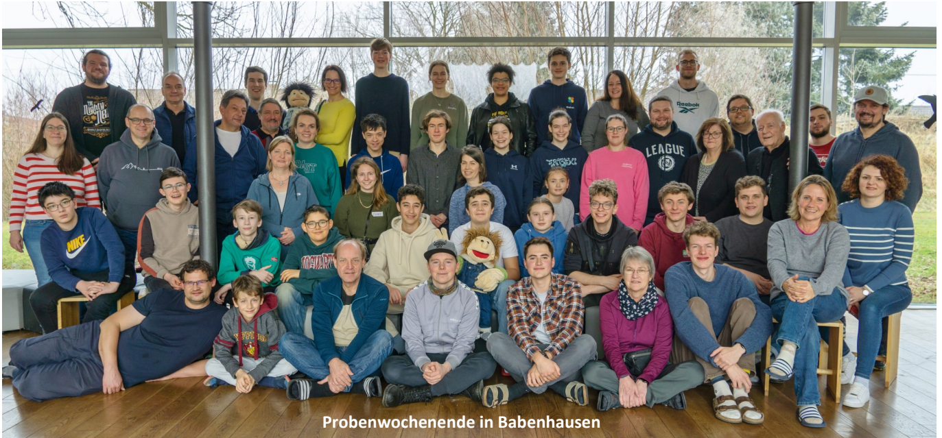
Probenwochenende in Babenhausen