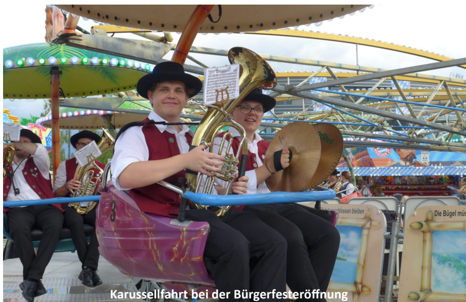
Karussellfahrt bei der Bürgerfesteröffnung