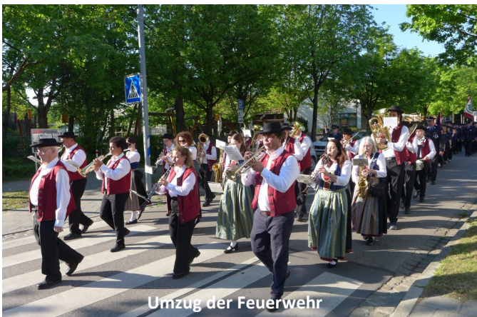
Umzug der Feuerwehr