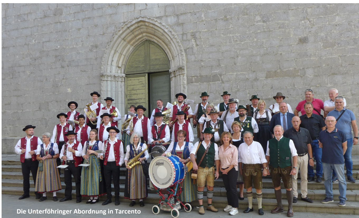
Die Unterföhringer Abordnung in Tarcento