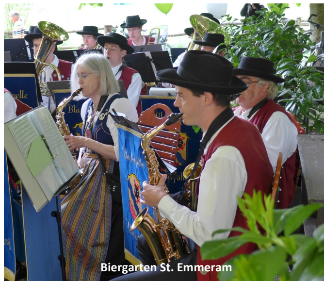
Biergarten St. Emmeram